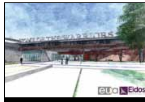
Concepto para la entrada al área de deportes de la Escuela Preparatoria Montbello

Inscriban a su estudiante hoy mismo en la Escuela Preparatoria Montbello High para el año escolar 2022-2023. Visiten montbellohs.dpsk12.org para obtener más información.