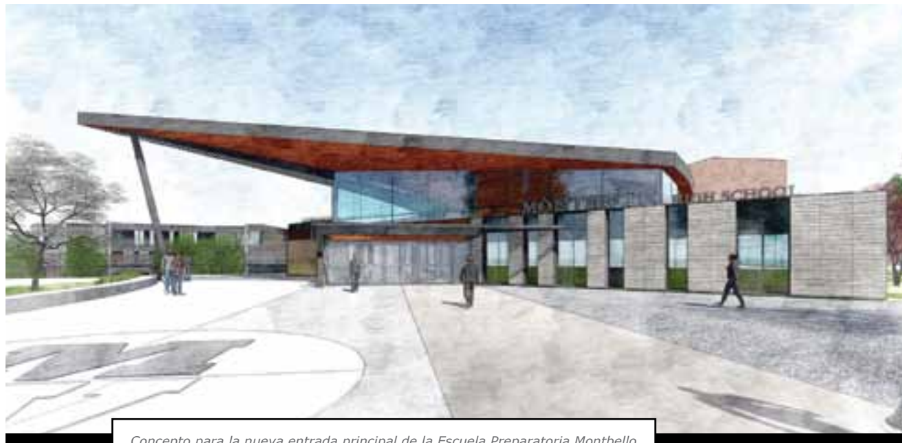
Concepto para la nueva entrada principal de la Escuela Preparatoria Montbello

“Creo que superé las expectativas”, dijo el alcalde con modestia. “Traté de hacer una diferencia en la vida de las personas”, dijo. Hacer eso, agregó, es lo que todos deberían hacer. “Ayudar a otros. Creo que he hecho eso.”