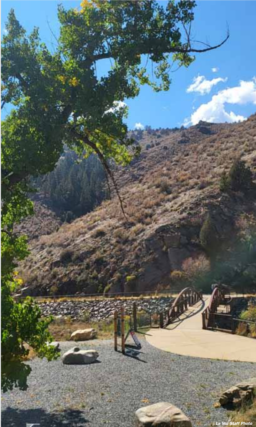
Riverwalk at Highway 6 from Black Hawk.

WE'VE LAUNCHED OUR NEW WEBSITE. VISIT US AT WWW.LAVOZCOLORADO.COM