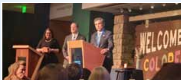
Event honoring former Denver Mayor Federico Peña with the CIVICO Vanguard Award.