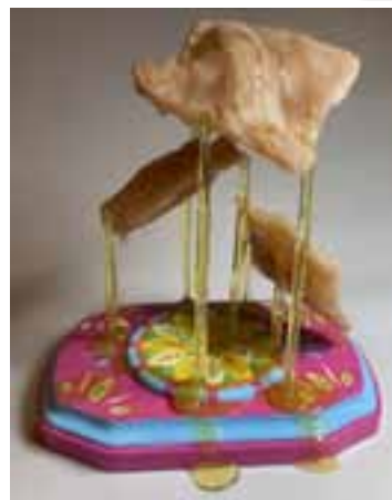
Casa Bonita Sopapilla

N EXT Gallery is thrilled to host the 6th Annual Casa Bonita Art Show! The show celebrates Casa Bonita - a 52,000 sq-ft restaurant in Lakewood, Colorado. The restaurant offers up a 3-story waterfall, gunfights, gorilla chases, puppet shows, a haunted cave and much, much more. You never know what you are going to get at this art show - The inspiration is endless. Opening night: February 17th 5-10 p.m. Show runs: February 17th-March 4th. Gallery hours Fri 5-10 p.m., Sat/Sun 12-5 p.m.