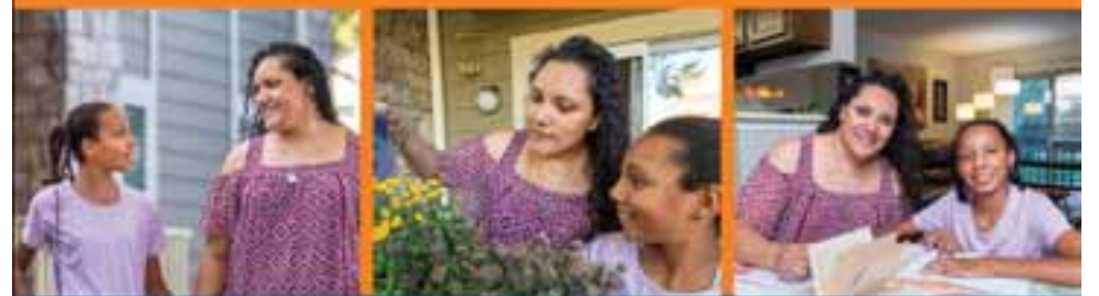
Familia Varesa, Cliente de CHFA y dueño de vivienda

¿le gustaría ser dueño de su propia vivienda?