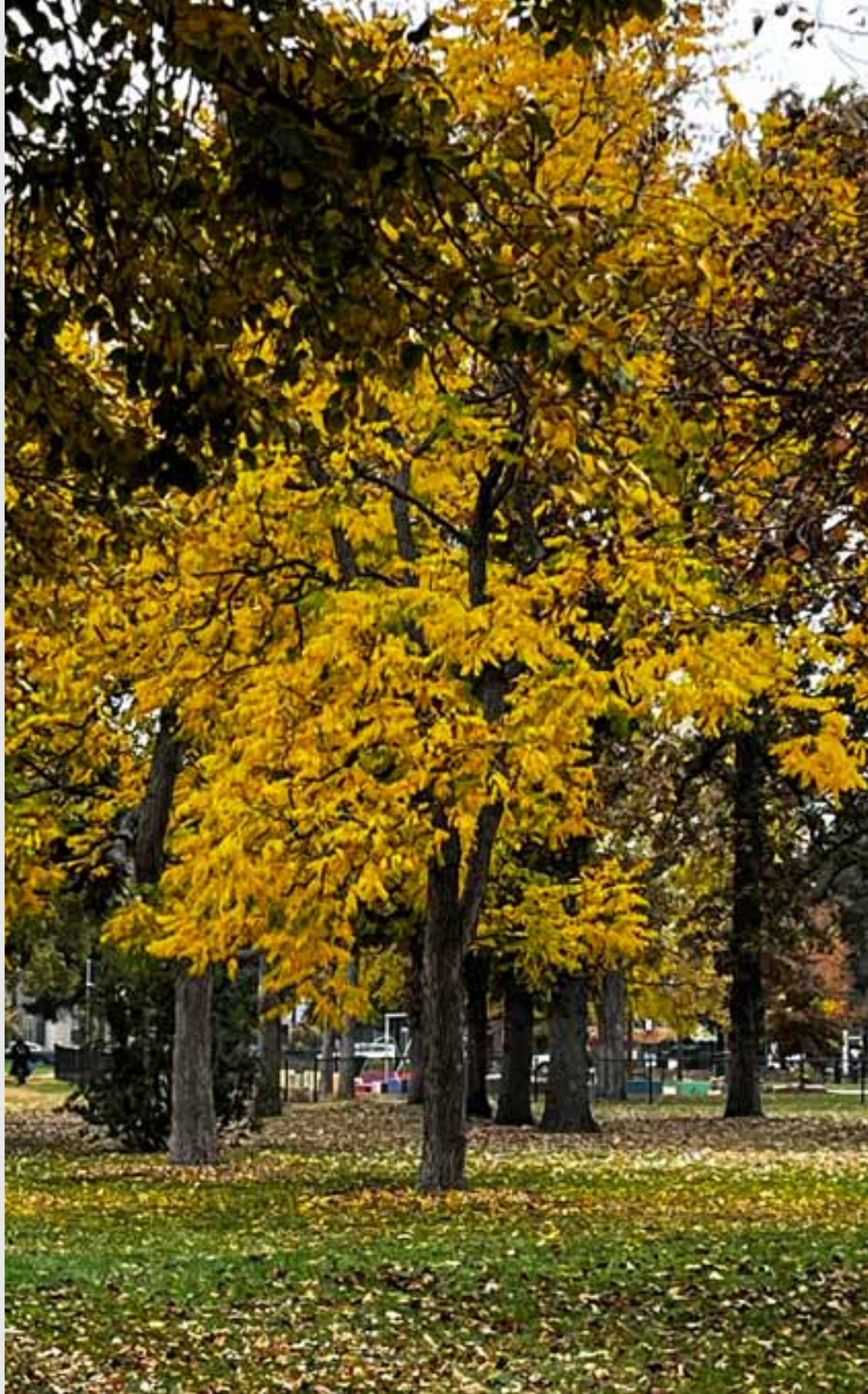
Alma - Lincoln Park

WHAT'S HAPPENING EVENTS CALENDAR, PAGE 8