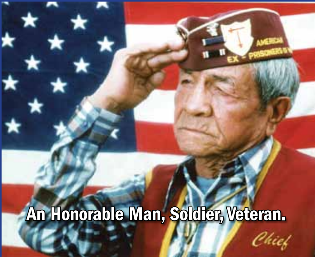
An Honorable Man, Soldier, Veteran.