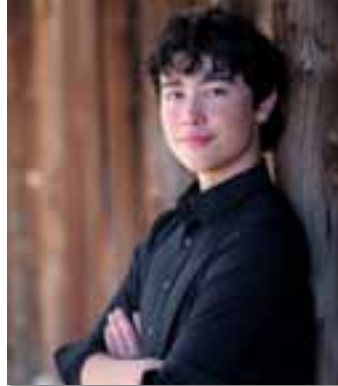
Solis Falcon East High School

Falcon has been accepted at Colorado State University-Fort Collins and University of Colorado-Denver.