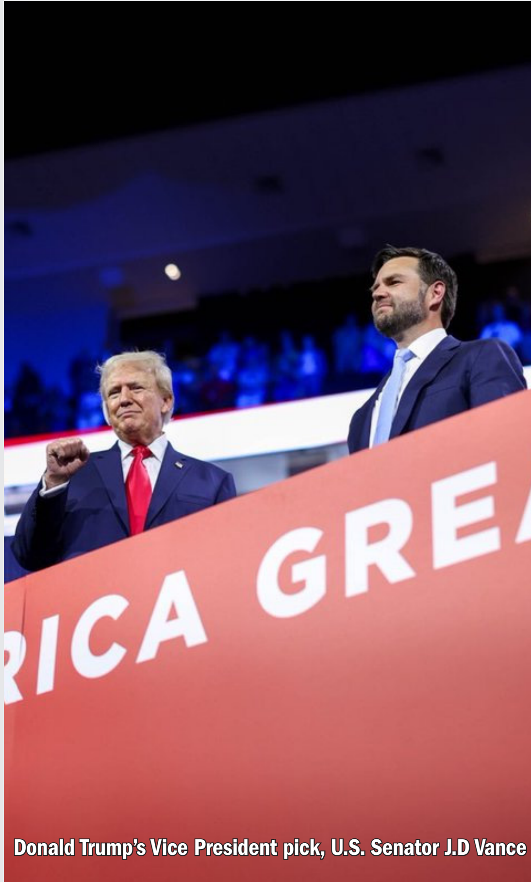
Donald Trump's Vice President pick, U.S. Senator J.D Vance

IN 1955 DISNEYLAND, "THE HAPPIEST PLACE ON EARTH," OPENED ITS DOORS FOR THE FIRST TIME