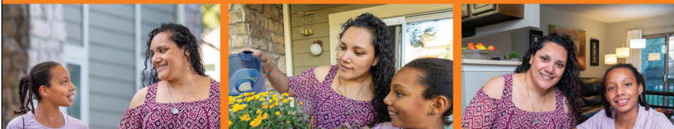
Familia Vanessa, Cliente de CHFA y dueño de vivienda