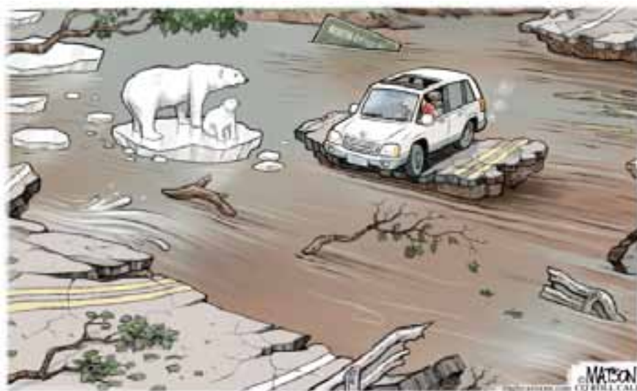
“WE KNOW THE FEELING.”

Los tribunales, más de 60, han confirmado que las elecciones de 2020 fueron justas y transparentes, no completamente perfectas y sin uno o dos fallos como suelen ser la mayoría de las elecciones nacionales, pero lo suficientemente buenas como para ser consideradas precisas.