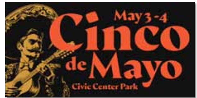
Graphic courtesy: Cinco de Mayo Denver/NEWSED

Come celebrate culture, community, and tradition at the Denver Cinco de Mayo Festival—a weekend filled with fun, food, and festivities! Learn more at cincodemayodenver.com . #CincoDeMayoDenver #CelebrateCulture #DenverFestivals #VolunteerDenver