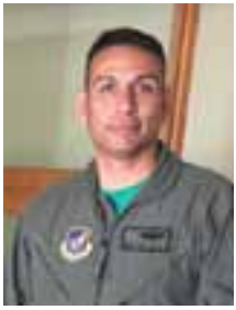
Ben Conde Guest Commentary

In early April, like many other Americans, I watched, listened and read about the miracle Air Force Rescue forces performed, fighting their way through enemy fire to rescue an F-15E Strike Eagle pilot that was shot down over Iran, ensuring that pilot's return to their family. While I am extremely proud of the people and teams that planned and executed this legendary feat, I also recognize that the grit, skill and courage they exhibited during this mission were borne of a tradition of service to others and sacrifice that they, their families, their predecessors, and their predecessors' families built over the course of several decades. "These things we do that others may live" is not just Air Force Rescue's motto, it is a testament to a life well spent in the service of others; a promise made by a small group of people that they will be there on the worst day of your life and will bring you home.